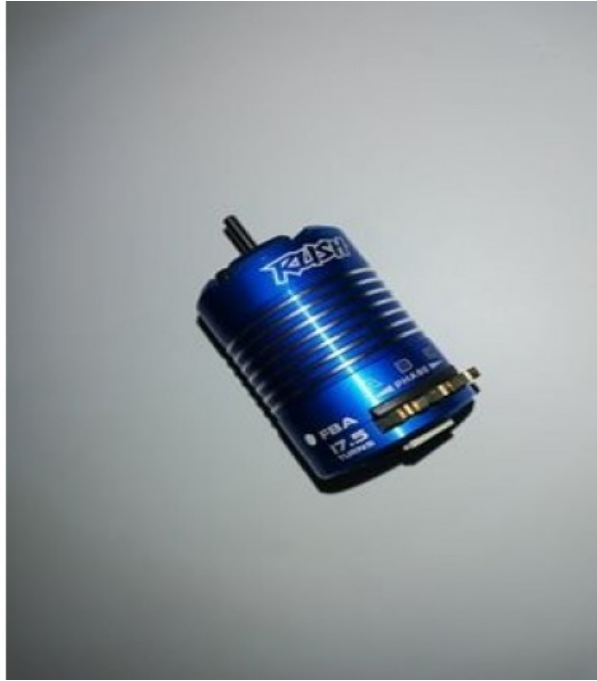
de carson brushless dragster combo 16t product code 500906246